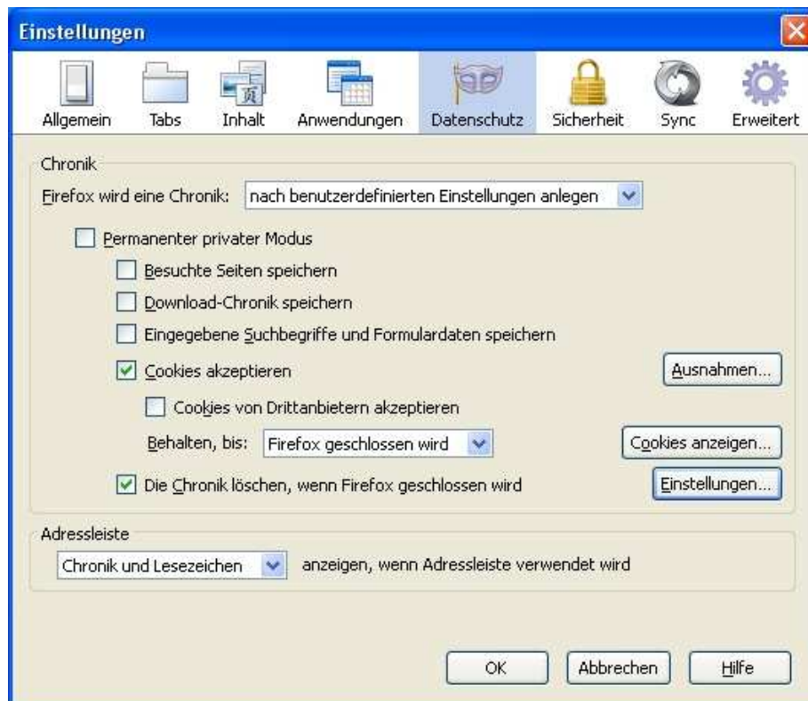
Abbildung 2-2 (Firefox 4.0)

Klicken Sie nun bitte den Reiter "Datenschutz" im Firefox Browser an und wählen Sie unter „Firefox wird eine Chronik: nach benutzerdefinierten Einstellungen anlegen“ aus.